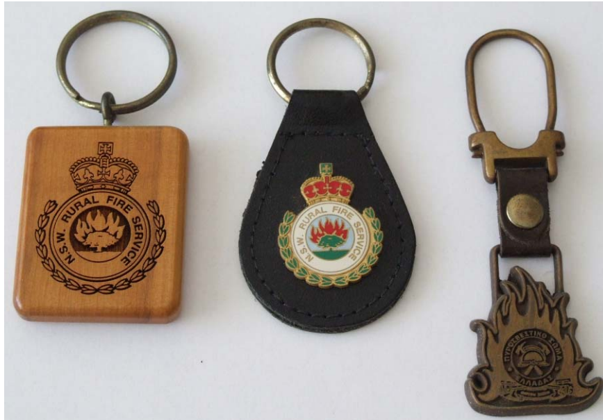
Μπρελόκ κλειδιών από την Αγροτική Πυροσβεστική Υπηρεσία της Νέας Νότιας Ουαλίας στην Αυστραλία και από το Πυροσβεστικό Σώμα στην Ελλάδα.